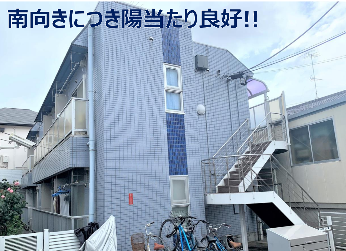
※図面と現況が異なる際は現況を優先します。